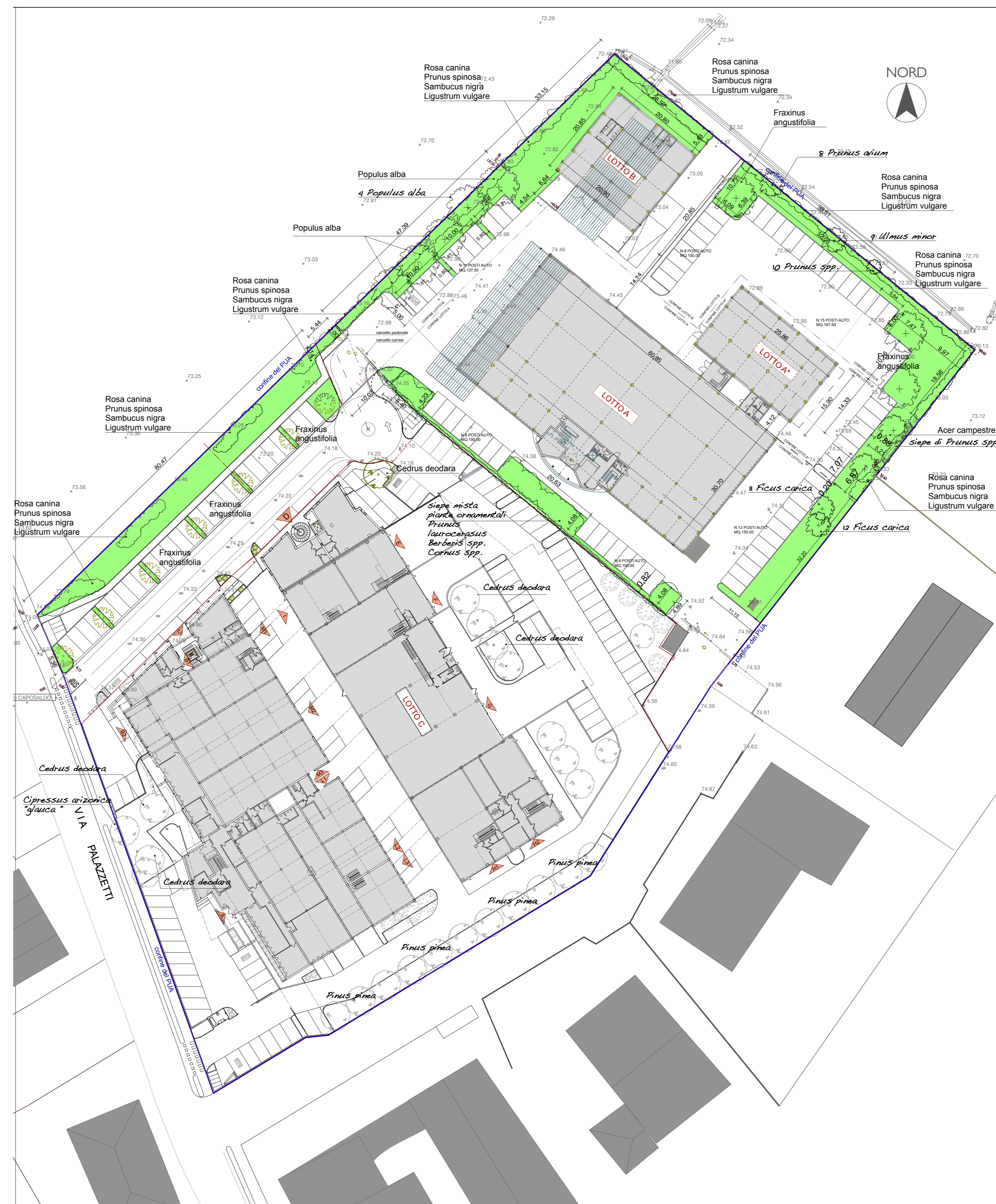
TAVOLA DEGLI INTERVENTI